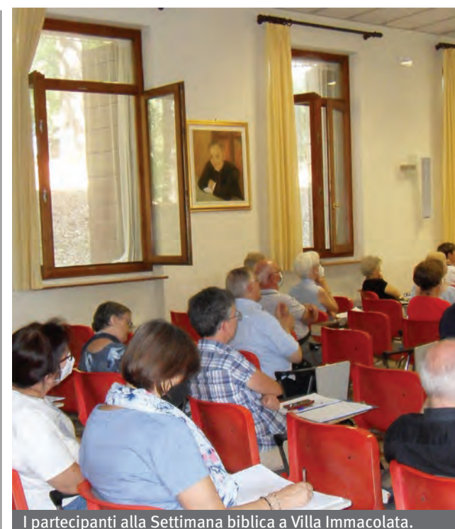
I partecipanti alla Settimana biblica a Villa Immacolata.