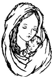
IMMAGINE DI MARIA: LUOGO DI PREGHIERA

Memoria di persone care da affidare a Maria