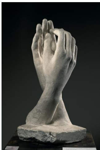
La main de Dieu - Francois Auguste René Rodin