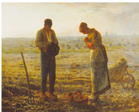
Angelus – Jean Francois Millet