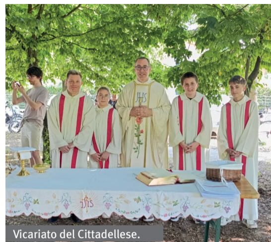
Vicariato del Cittadellese.

Tra i principali benefici emersi dall'esperienza formativa si riconosce una maggiore consapevolezza del ruolo del catechista come narratore della fede. Introdurre bambini e ragazzi alla fede significa accompagnarli dentro una storia di relazione, quella che Dio ha scelto di vivere con l'umanità. I catechisti hanno riletto il proprio servizio come accompagnamento attento alle persone. Questo metodo ha contagiato diverse realtà, da Pozzetto e Cassola fino alle frazioni più piccole, integrando le dispense diocesane con