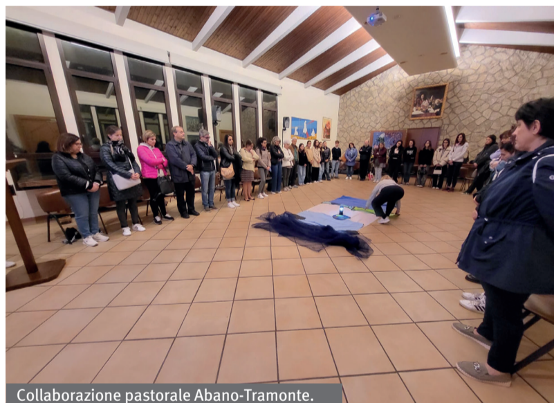
Collaborazione pastorale Abano-Tramonte.